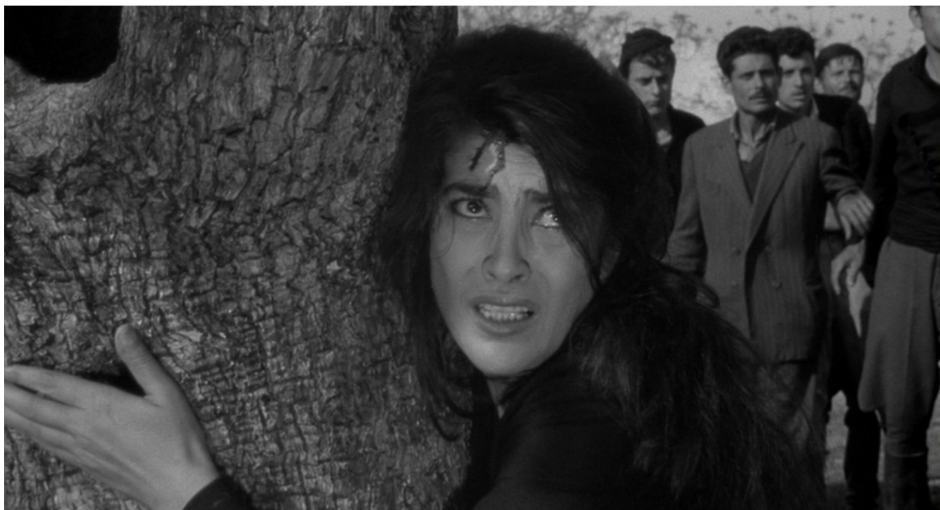
Ирины Папа в фильме «Грек Зорба» с Энтони Куином.

Она несколько лукавила: в греческих фильмах, до своего отъезда за океан Ирина Папа как раз играла этих самых роковых женщин, как в фильме 1948 года (всего лишь в 22-х летнем возрасте!) «Падшие ангелы». Правда, роковые женщины 40-ых годов сильно отличались от роковых женщин нашего времени, которые снимают с себя все до последней нитки: на их фоне женщины-вамп прошлого века выглядели просто монашенками!