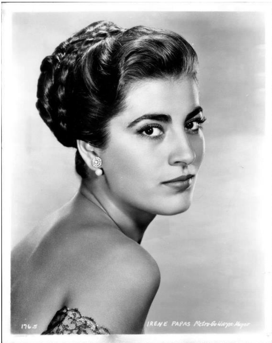
Ирины Папа.

Настоящее имя Ирины Папа – Ирины Лелеку. Она родилась 3 сентября 1926 года в крошечном поселке Хилиомоди, недалеко от Коринфа, в семье школьных учителей. Оба были филологами, а отец вдобавок – великий знаток античной драмы.