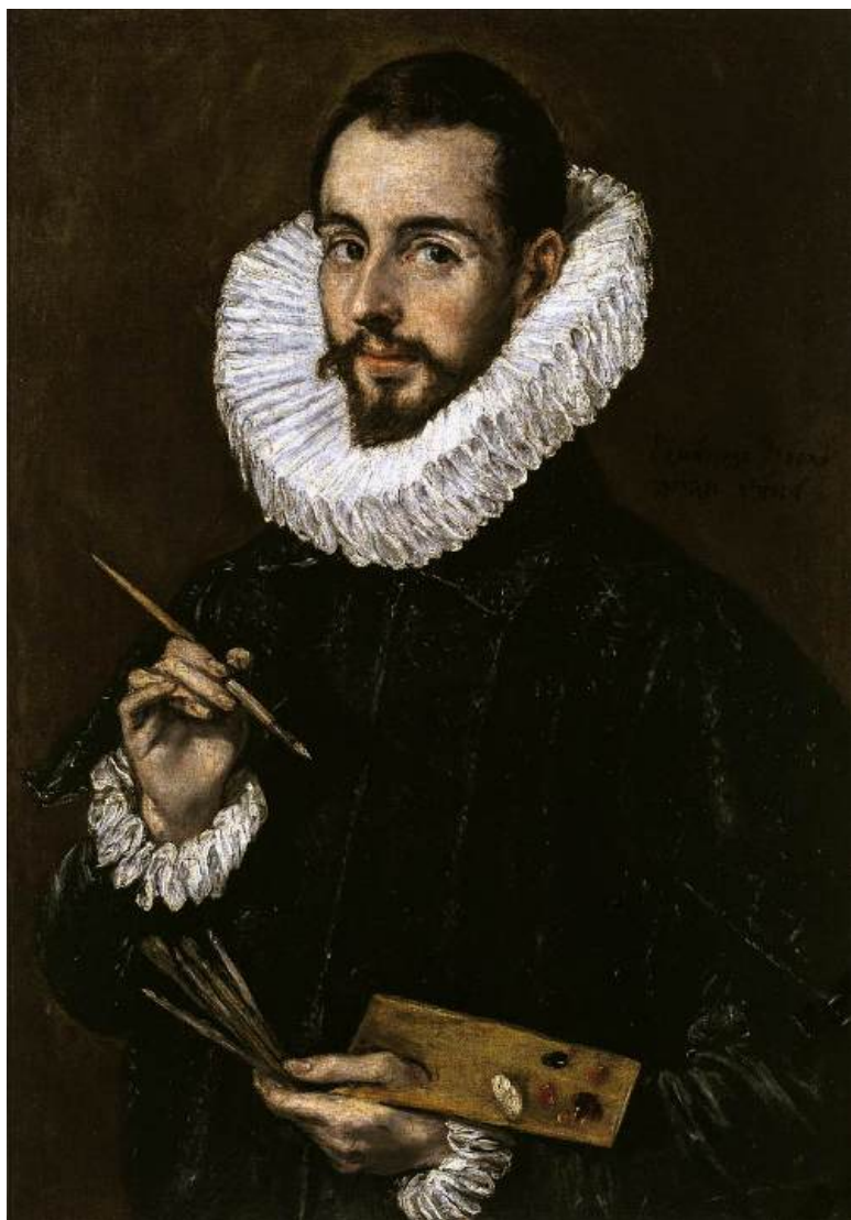
Эль Греко. Хорхе Теотокопулос.

Умер Эль Греко в 1614 году, в возрасте 73-х лет, и был похоронен в монастыре Санто Доминго эль Антигу, как того и желал. Позже его перенесут в Храм Святого Торквата, который затем был разрушен войсками Наполеона.