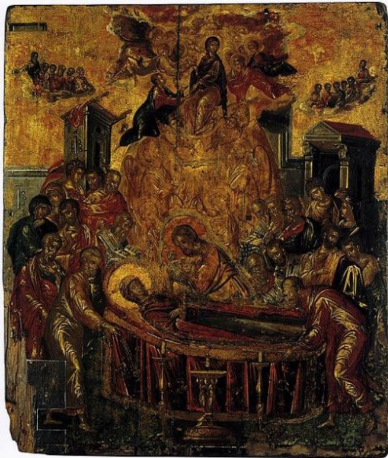
Эль Греко. Успение Богородицы Псарьянон. (Эрмуполи, о. Сирос)

Можно, конечно, провести небольшую «тренировку», «не отходя от кассы»: в Эрмитаже, в Санкт-Петербурге, выставляется единственное полотно Эль Греко – «Святые Апостолы Петр и Павел». Хотя, признаюсь честно: полотно в свое время на меня должного впечатления не произвело, и по-настоящему душа моя раскрылась навстречу Эль Греко много лет спустя, когда в Музее Метрополитен, в Нью-Йорке, на меня жарко дыхнула майская гроза с холста Эль Греко «Тоledo».