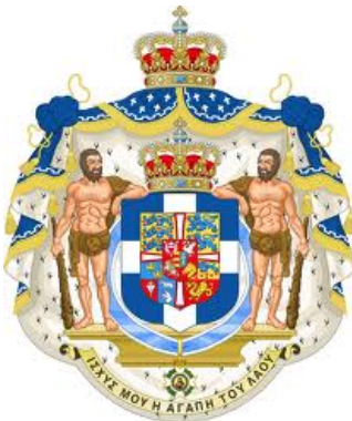
Герб Королевства Греция времен короля Георга II. Использовался 1936–1973

В 1935 году к власти вернулась династия Глюксбергов, а вместе с ней и герб времен 1863-1924 годов.