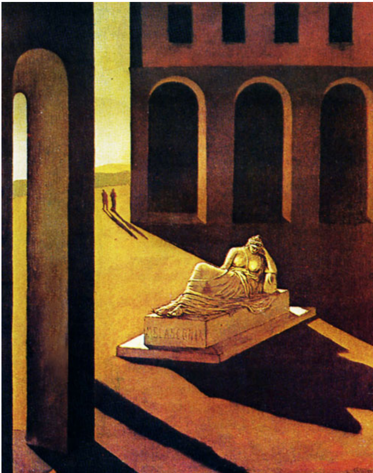
Де Кирико. Меланхолия. 1912