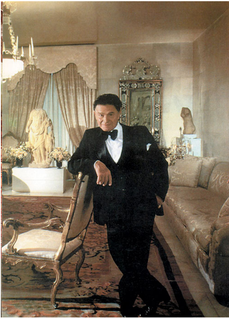
Александр Иолас.

Столетие Александра Иоласа в 2007 году никем не отмечалось. Его имя практически было предано забвению или звучало в связи с очередными скандальными деталями его жизни. Коллекция Иоласа была частично вывезена, частично – разграблена, а изумительный дворец-музей в афинском районе Агия Параскеви – осквернен, изуродован, опустошен.