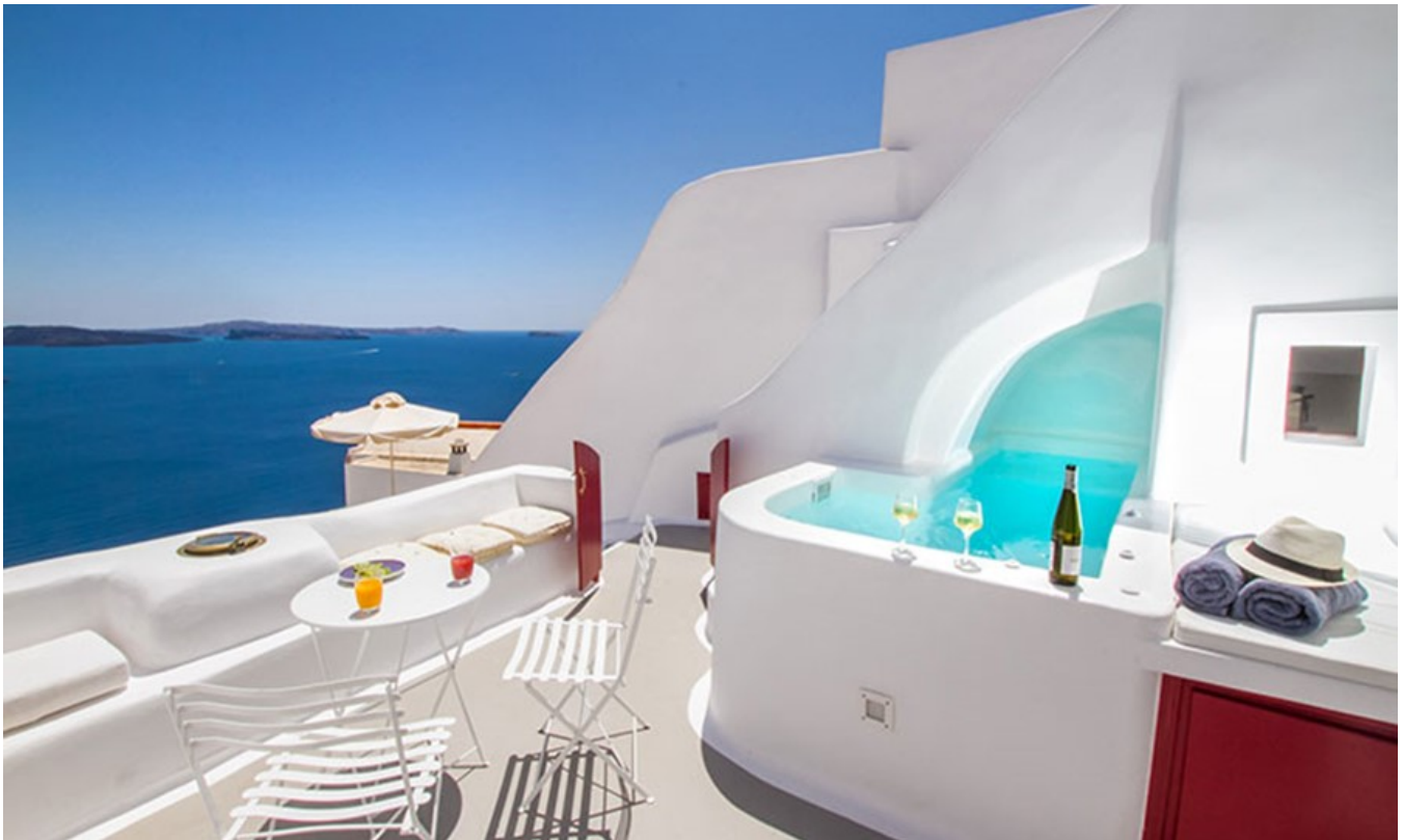
Nemo enim ipsam voluptatem

Санторини вновь попал в первые строчки мировых рейтингов. На этот раз греческий остров отличился роскошными пещерами, которые включены местными отелями в состав своего номерного фонда.